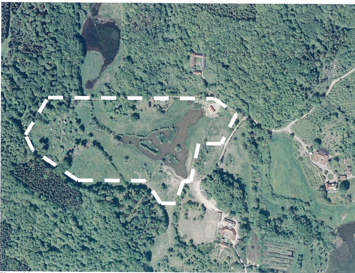
Planområdets ungefärliga avgränsning

Någon uppgift om registrerad fornlämning inom området finns inte. Med hänsyn till att landskapet kring Råbelövssjön är rikt på fornlämningar och att lösfynd från stenåldern hittats i anslutning till Tommarps gård, som indikerar att en boplats kan finnas i anslutning till fyndplatsen, kan krav komma att ställas från Länsstyrelsen på arkeologisk utredning/undersökning i samband med fortsatt planläggning och exploatering av området. För ingrepp i eller borttagning av eventuella fornlämningar krävs Länsstyrelsens tillstånd. För ingrepp i biotopskyddade områden krävs dispens från Länsstyrelsen.