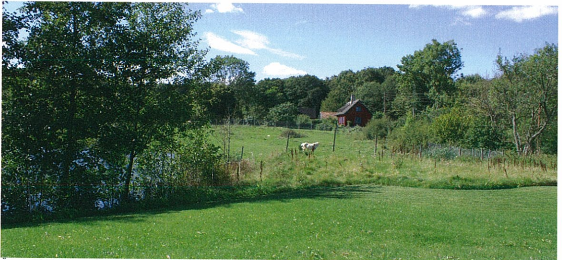
Ängsmarken norr om dammen med fastigheten Tommarp 1:9 i fonden

Utrymme för erforderligt mindre reningsverk och transformatorstation tillgodoses i anslutning till dammens utlopp respektive områdets anslutning till befintlig markväg i nordväst.