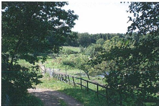
Nerfarten till parkeringen till Tommarps gårdshotell

Renhållningen Kristianstad AB svarar för sophantering. Källsortering av hushållsavfall har införts.