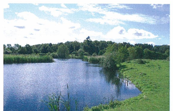
Dammen sett från norr