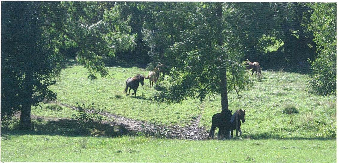
Ängsmarken väster om dammen med Svartagylsbäcken i sänkan

För kollektivtrafiken utmed väg 2060/Arkelstorpsvägen innebär planförslaget ingen förändring.