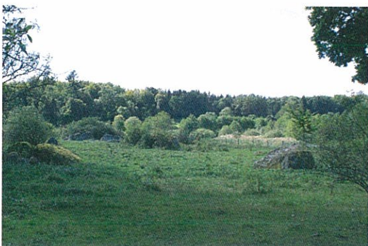
Vy över området från Helmershusvägen i nordost