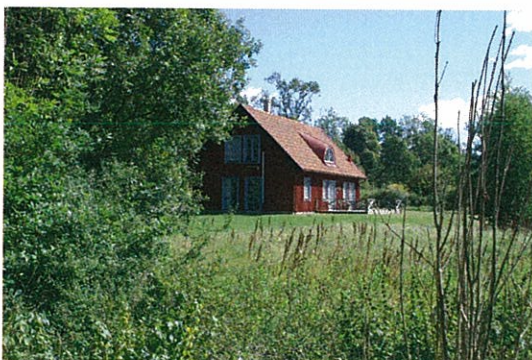
Befintlig bebyggelse inom Tommarp 1:13 och 1:9

Utrymme för samvaro, lek och rekreation tillgodoses på de idag relativt öppna äng- och betesmarkerna omkring dammen. Sammanlagt redovisas ca 6,7 ha naturmark som äng och damm läggas ut inom området. Viktigt är att områdets relativt öppna ängsmarkskaraktär här kan bibehållas och förstärkas och att detta lämpligen sker genom fortsatt bete och regleras i en skötselplan för naturmarken. Utrymme för närlek tillgodoses inom egen tomtplats.