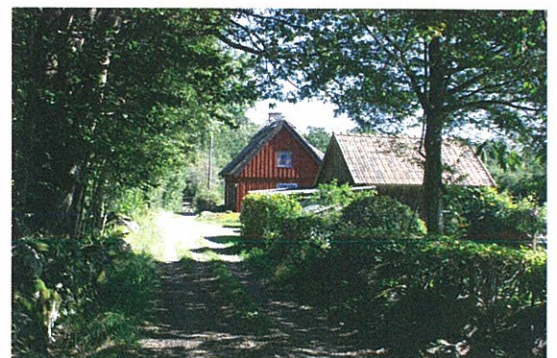
Helmershusvägen med fastigheten Tommarp 1:9